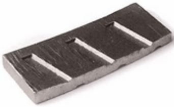
Slant Slot Edge Segment