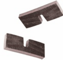
U Slot Edge Segment