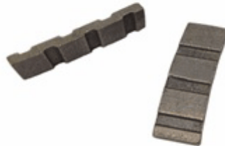
Turbo Shape Edge Segment