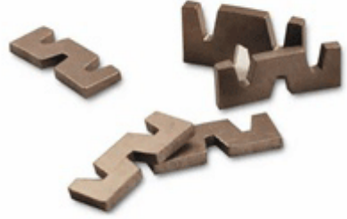
W Shape Edge Segment