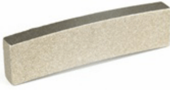
Fan Shape Edge Segment