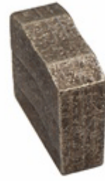
M Shape Block Segment