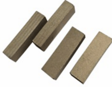
Normal Shape Edge Segment