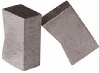
K Shape Block Segment