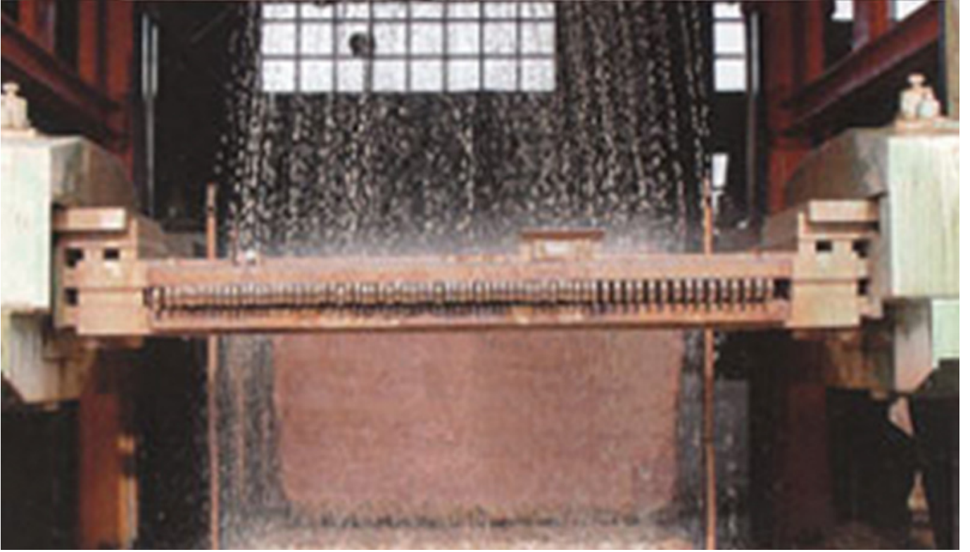
شريحة عصابة الماس للموردين.