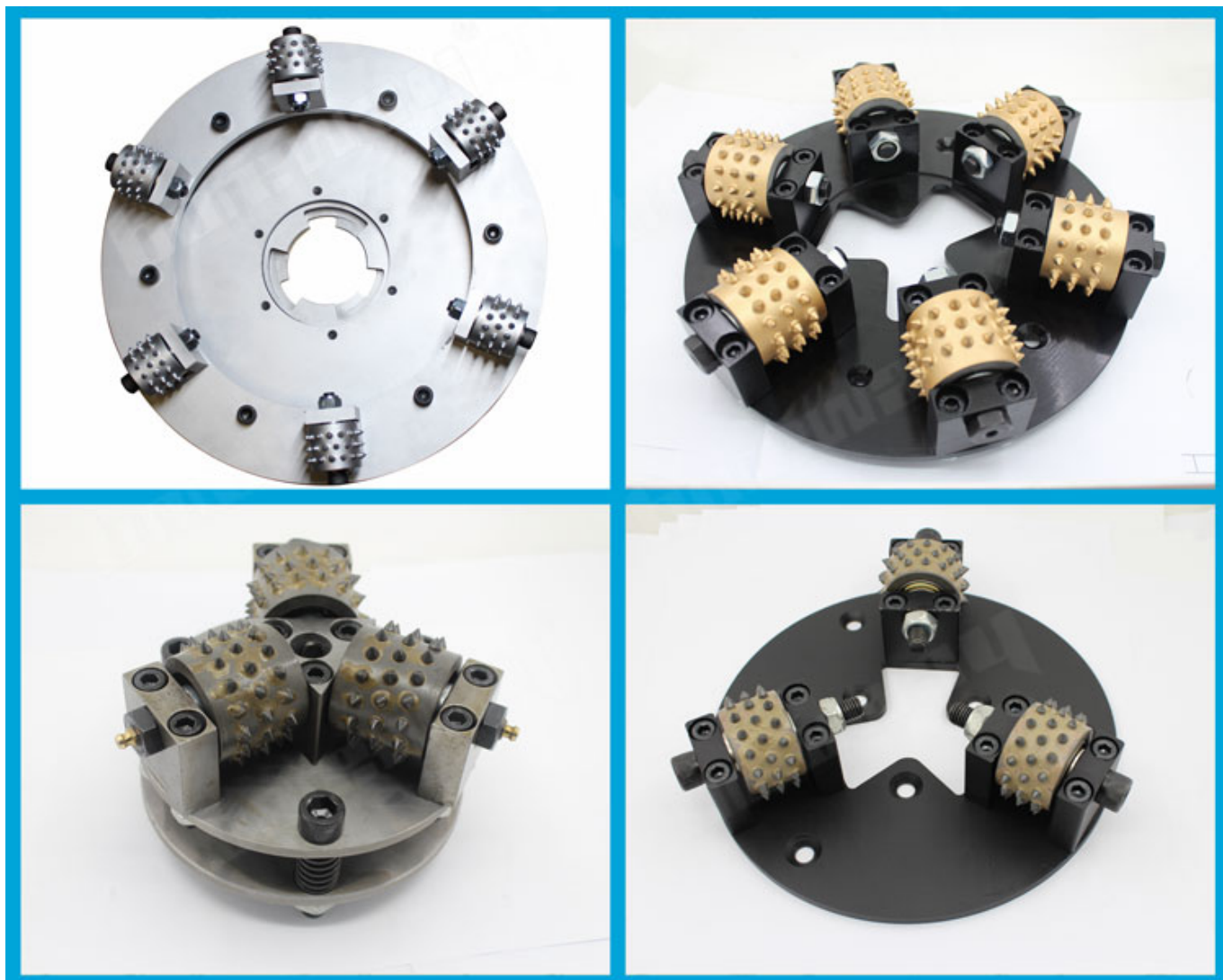
منتجات ذات صله