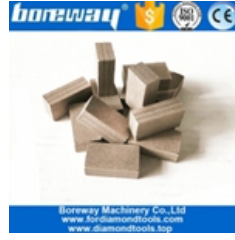
كتلة قطع الرخام