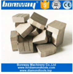
كتلة قطع الجرانيت