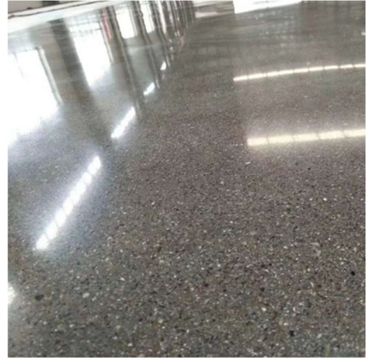
After Grinding and Polishing