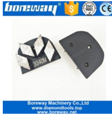
ثلاثة قطاعات طحن الأحذية