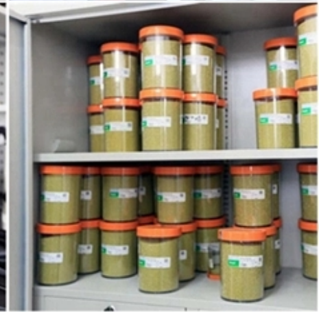
التعبئة ، التسليم :