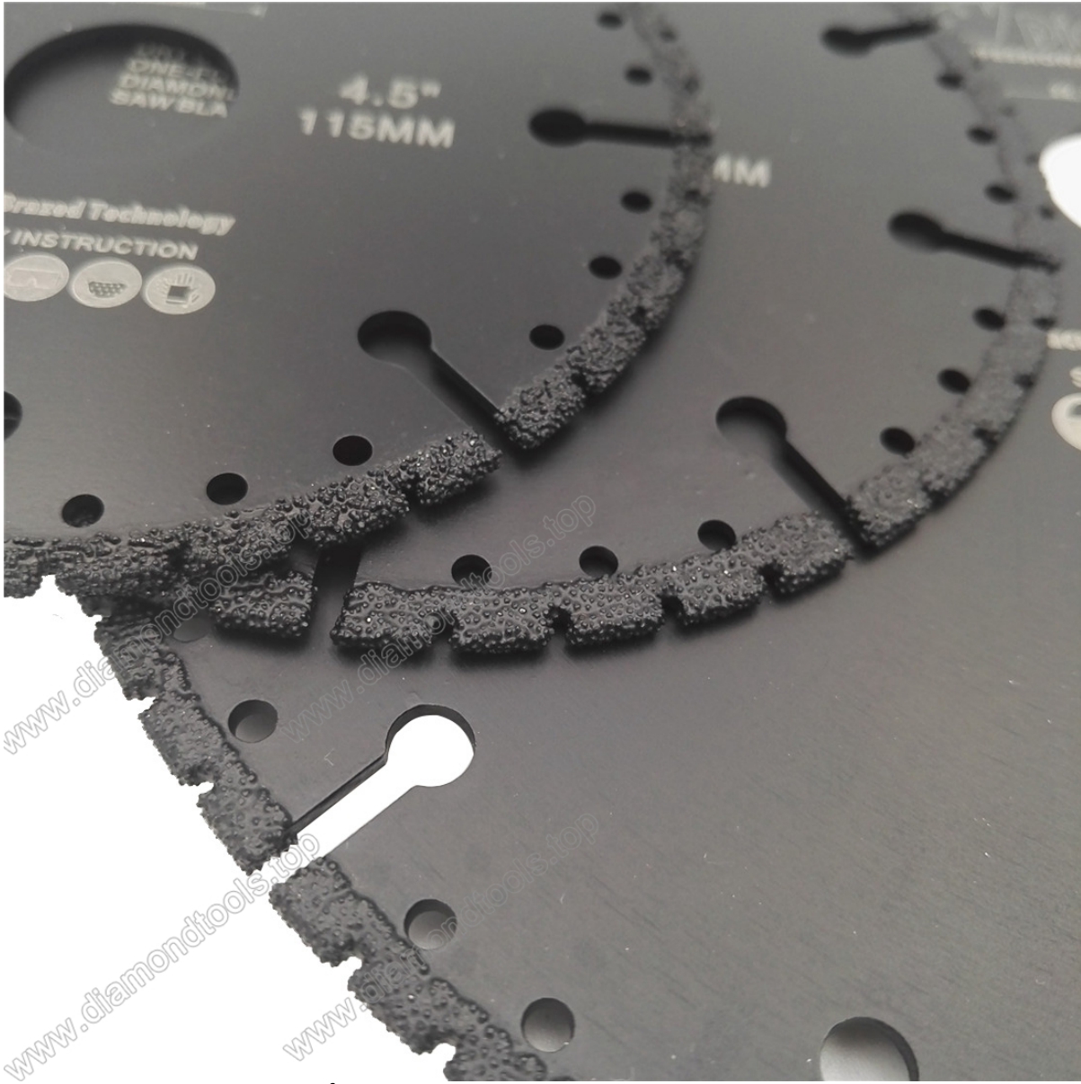
فراغ الماس ملحومة بليد لجميع الأغراض بليد الهدم 115MM