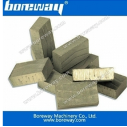
قطعة كتلة القطع للرخام