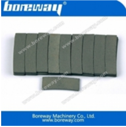
حافة قطع الجزء للحرانبت