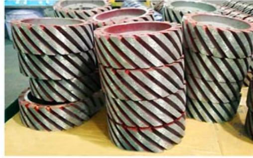
Diamond Satellite Wheel/ Rollers