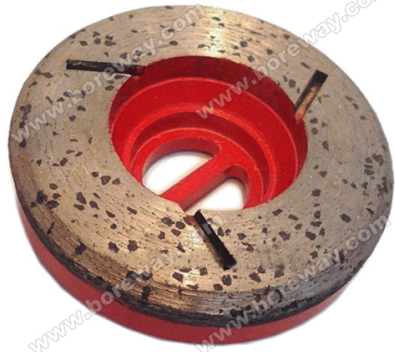
Boreway Machinery Co., Ltd. www.diamondtools.top www.boreway.com