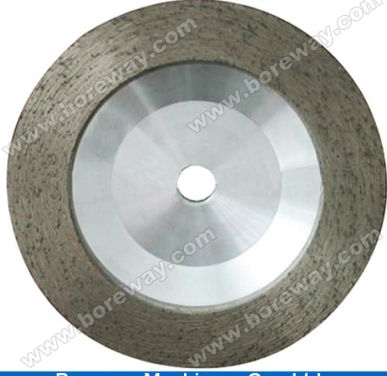
Boreway Machinery Co., Ltd. www.diamondtools.top www.boreway.com