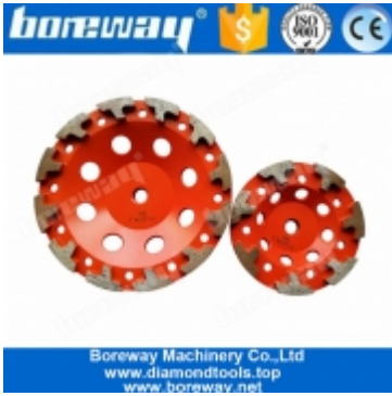
الماس طحن عجلة الكأس "T" بوصة 7