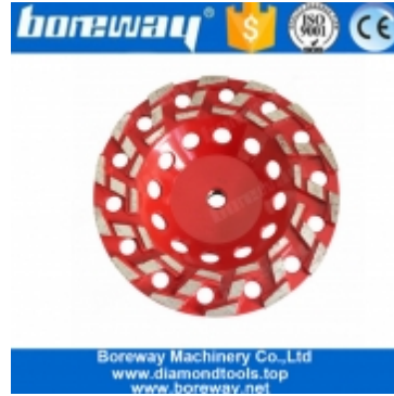
الماس طحن عجلة الكأس "S" بوصة 7