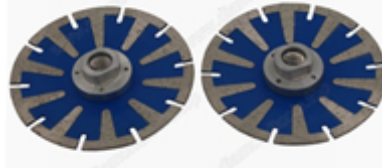
شريحة الماس فتحة U 350mm

Boreway Machinery Co., Ltd www.diamondtools.top www.boreway.com