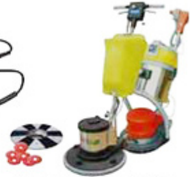
Floor polishing machine