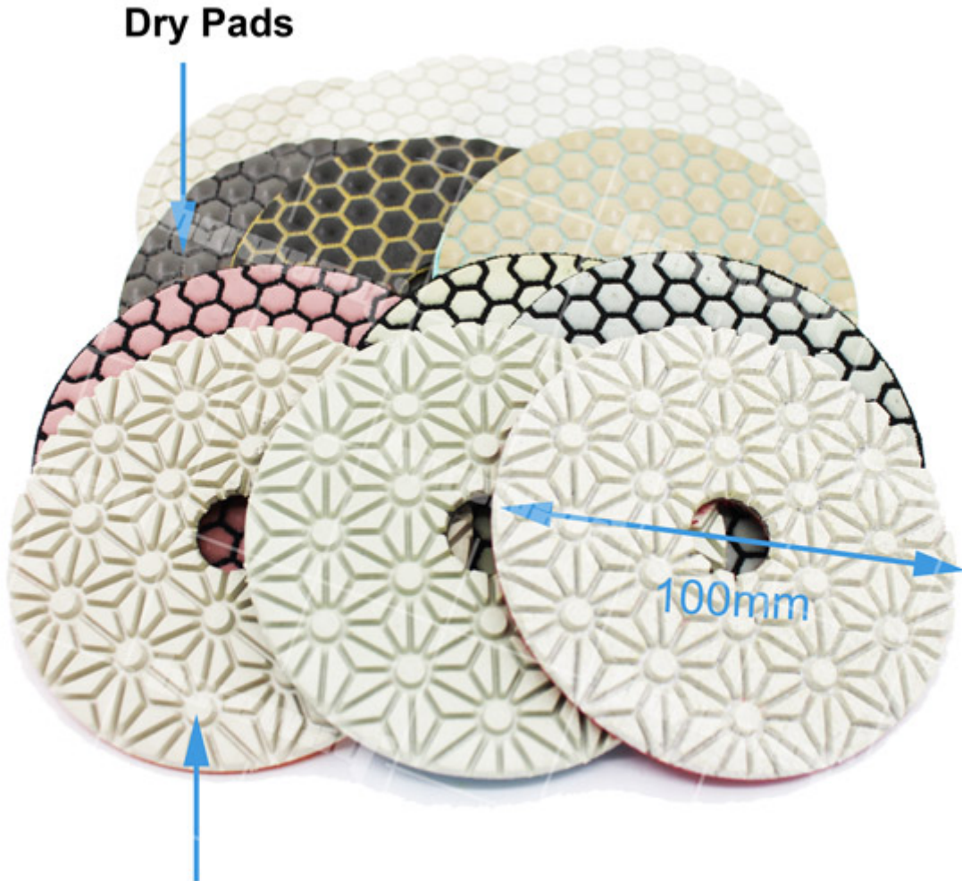
Flower Shape Diamond Pads

مع المتانة العالية وتأثيرات التلميع الفائقة ، تم استخدام وسادة تلميع الماس على نطاق واسع كوسادات تلميع الخرسانة ، وسادات تلميع الجرانيت ، ومنصات تلميع الرخام ، إلخ. لتجهيز الأسطح الحجرية والخرسانية. يمكن استخدامها في طحن وتلميع كل من الأسطح المسطحة والمنحنية من الحجر الطبيعي والاصطناعي ، وهي أيضًا مجموعة شائعة من أدوات الماس لإصلاح وترميم سطح الحجر. أنواع من الحجر سهلة وسريعة الجفاف. مثل الجرانيت والرخام والحجر الرملي والحجر الجيري وما إلى ذلك مع تلميع طويل العمر.