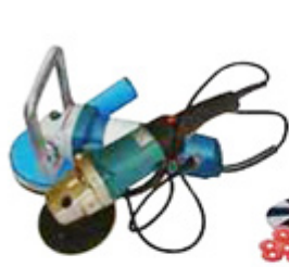
hand polishing machine