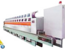
Ceramics polishing machine