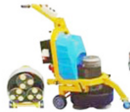
Large floor polishing machine