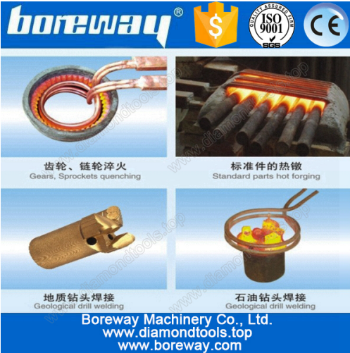
A variety of materials welding

المرفق: القدم التبدیل / ومن ناحية الصحافة التبدیل، لغائف التدفئة (يمكن تخصيص)، وأنايب (المياه، ومضخات المياه (بحاجة لشراء مواصفات أخرى يمكن تخصيصها وفقا لمتطلبات قبل شراء الجهاز، يرجى تقديم مواصفات الشغل اللحام