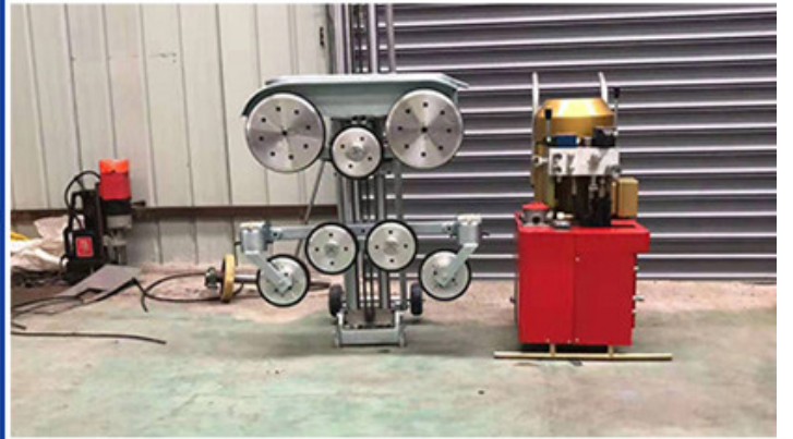
Hydraulic Wire Saw Cutting Machine