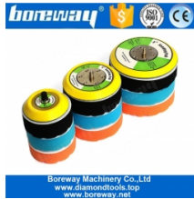
5/16 "-24 Thread Backer Pad