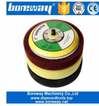
بوصة رغوة باكر الوسادة 5