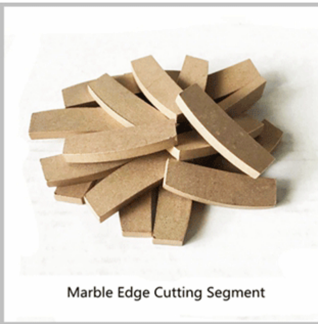
Marble Edge Cutting Segment