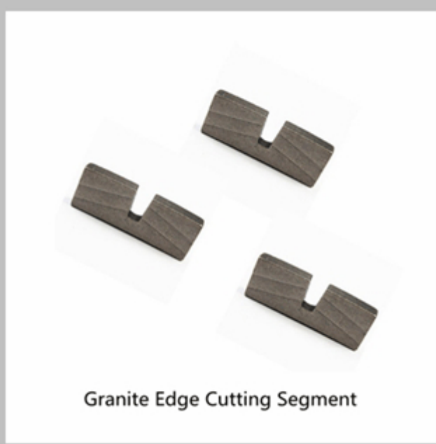
Granite Edge Cutting Segment