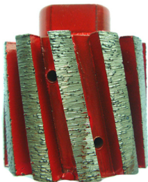
Boreway Machinery Co., Ltd. www.diamondtools.top www.boreway.com