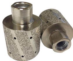
Boreway Machinery Co., Ltd. www.diamondtools.top www.boreway.com