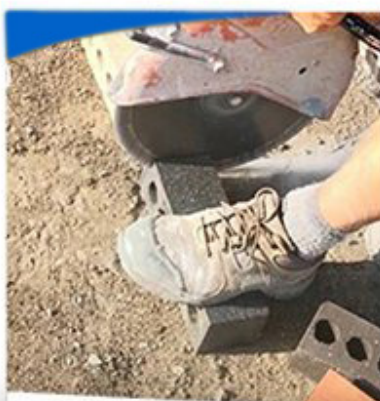
Hard Masonry Block