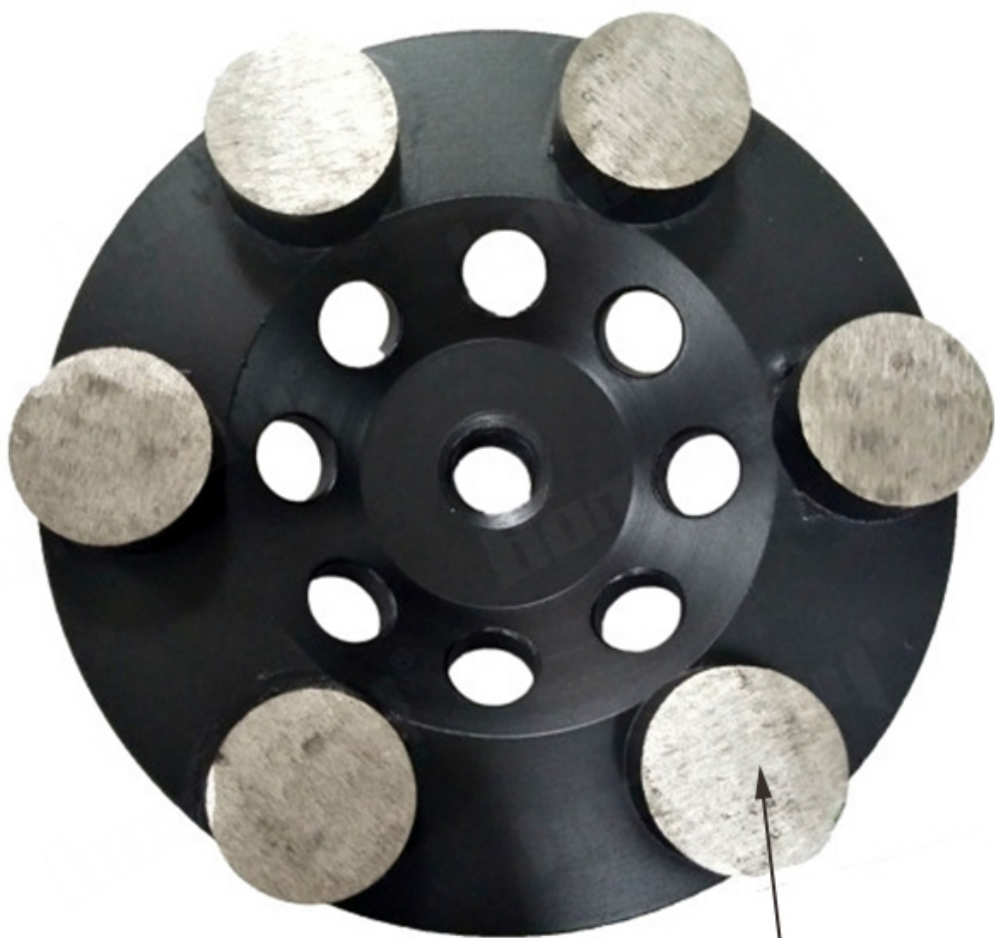
D25mm*H12.5mm*6T Six Diamond Segments