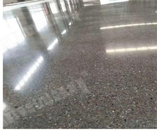
After Grinding and Polishing