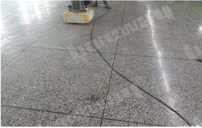
Before Grinding and Polishing