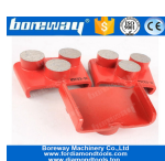
3 II giro macinazione Scarpe