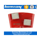
2 mole quadrate Scarpe