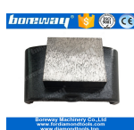
1 Grande Piazza macinazione Scarpe