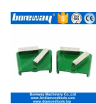
2 bar macinazione Scarpe