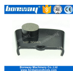
1 round macinazione Scarpe