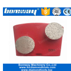
2 II giro macinazione Scarpe