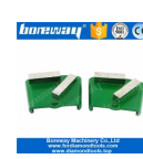
Mole da rettifica a 2 barre