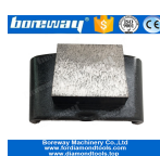
1 Grande Piazza macinazione Scarpe