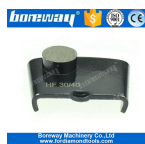
1 round macinazione Scarpe