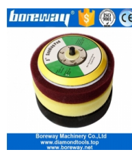
Fondello in schiuma da 5 pollici