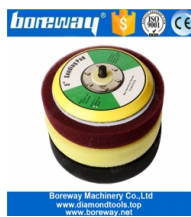
Fondello in schiuma da 5 pollici