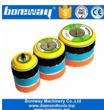
5/16 "-24 Backer Pad