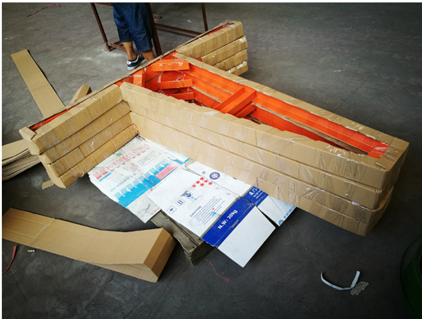
Emballage & livraison