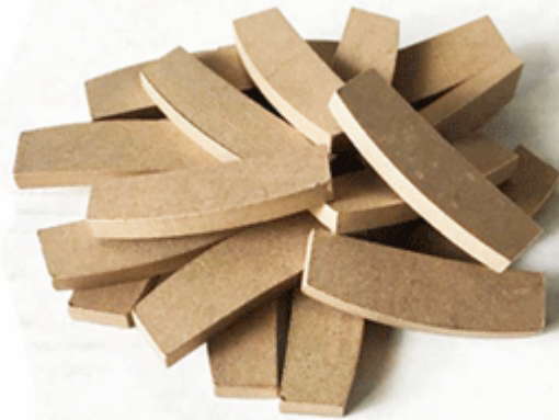
Marble Edge Cutting Segment