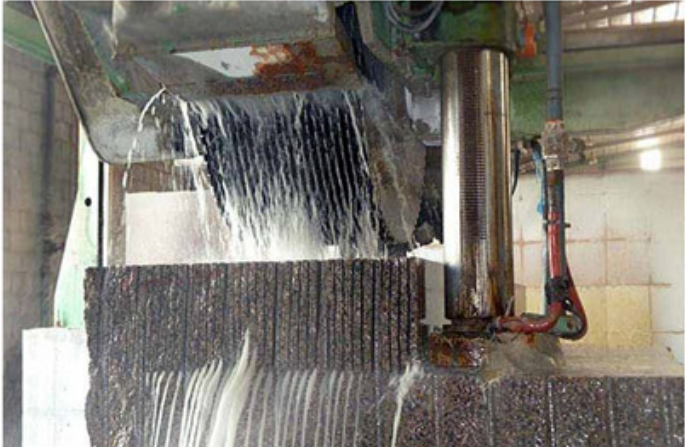
Single Saw Blade