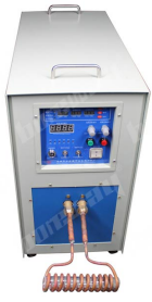
Three Phase 380V 30kW High Frequency Induction Welding Machine