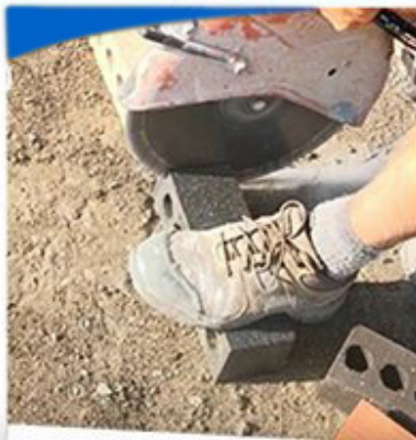
Hard Masonry Block