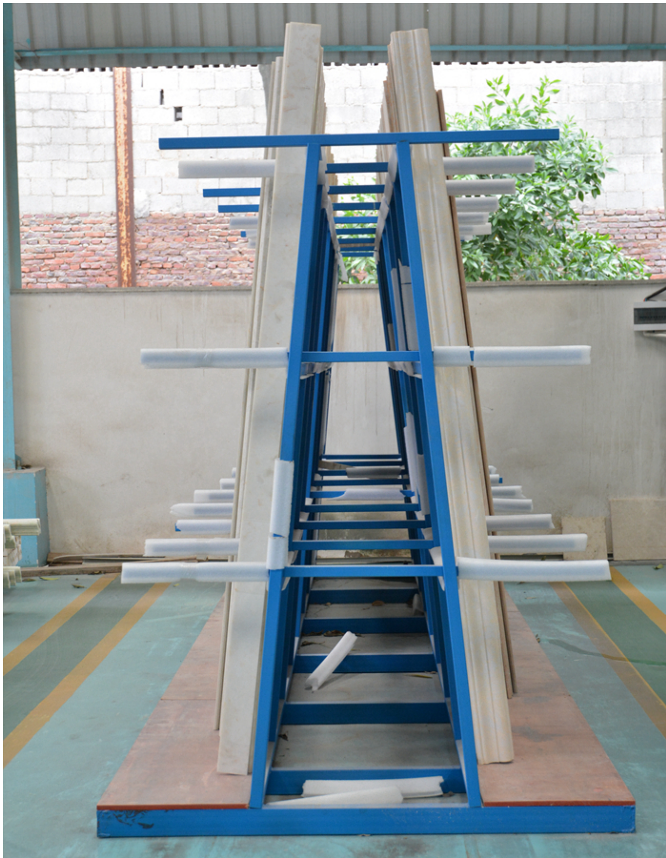
Embalaje & entrega