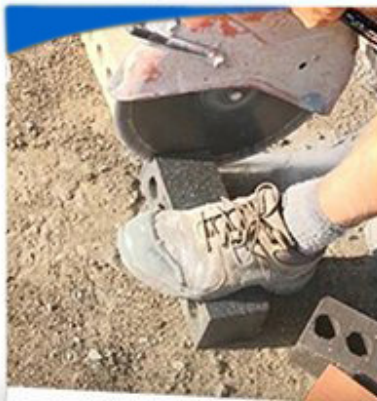
Hard Masonry Block