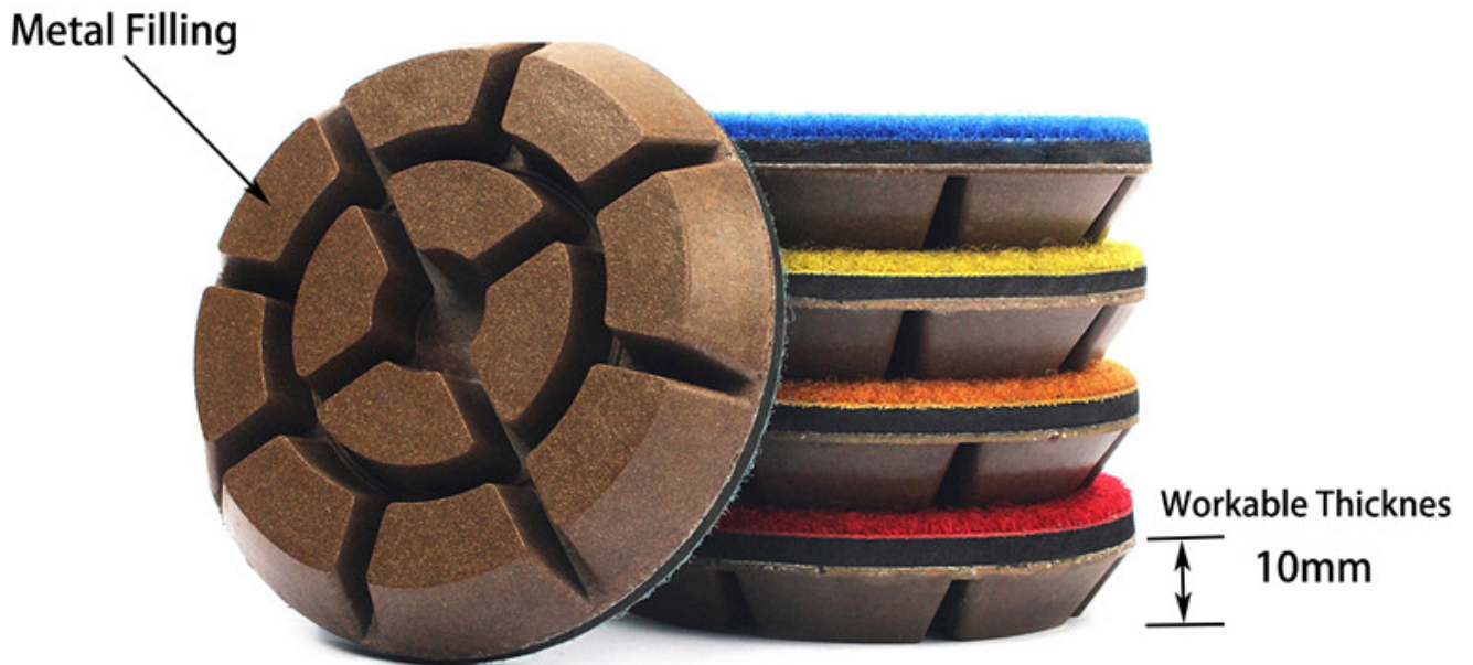
Metal Filling Diamond Resin Bond Polishing Pads For Concrete Floor