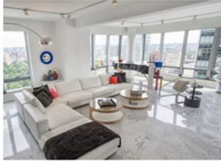
In Living Romm