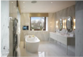
In The Dressing Room