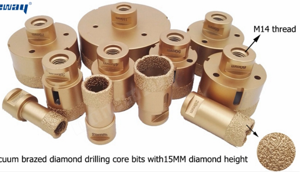
Vacuum brazed diamond drilling core bits with 15MM diamond height