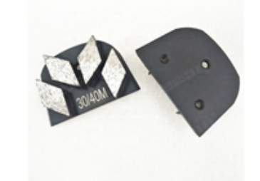
Boreway Machinery Co.,Ltd www.diamondtools.top www.boreway.net