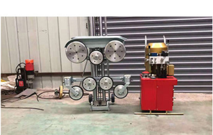
Hydraulic Wire Saw Cutting Machine